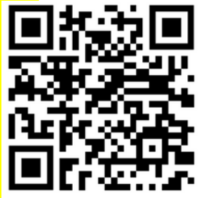
Base de connaissances